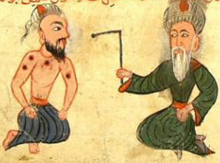
اللّٰهِي التَّيْبِي نَمَه لَدَاكِي يَا بَنِي