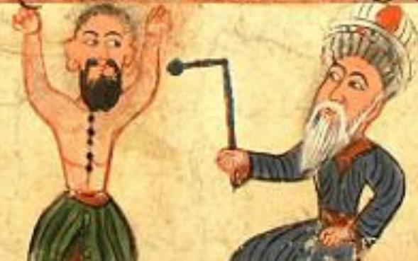
صَوْرَه طَبِيْب وَ شَكْل آت وَ صَوْرَه عَلِيك بُو نَكِر دَر

نَافِضَاكِي يَعْنِي اَشْمَا رَقَادَن طَمَاغِنَاك دَاغِنَاك طَرِيقَه سِن بِلْدَرَز بِلِخَل اِي خَطَاب كِه هَر جَنَاكِه بِر كِشِيه بُو مَرَض خَا دَث اَو تَسَايِكِر لَو تَه صَوَقَا اِي لَمَكْدَن بَه حَمِي رِيغ عَرَضِي نَدَن يَا غِي رِي نَسَنَه سَبِي نَدَن اِنَس كَر كَر دَر كِر بِي ش بِرْدَه اَرَقَه خَر زَه كِر نَدَه يَعْنِي اَرَقَه اَو كِر عَا لَو تَه وَ بِرْدَه اَغ دَاخ كَلِس اَز رِنَه اِي دَسِن وَ بِرْدَه اَغ دَاخ مِي دَه سِي اَز رِنَه اِي دَسِن زِي شُو يِي بِلَه مَرَض نَفِض بُو لَه نَافِض كِلَه