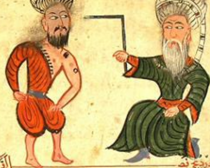
اللّٰهِي دَرِيغِي نَمَه لَدَاكِي يَا بَنِي

نَافِضَاكِي يَعْنِي اَشْمَا رَقَادَن طَمَاغِنَاك دَاغِنَاك طَرِيقَه سِن بِلْدَرَز بِلِخَل اِي خَطَاب كِه هَر جَنَاكِه بِر كِشِيه بُو مَرَض خَا دَث اَو تَسَايِكِر لَو تَه صَوَقَا اِي لَمَكْدَن بَه حَمِي رِيغ عَرَضِي نَدَن يَا غِي رِي نَسَنَه سَبِي نَدَن اِنَس كَر كَر دَر كِر بِي ش بِرْدَه اَرَقَه خَر زَه كِر نَدَه يَعْنِي اَرَقَه اَو كِر عَا لَو تَه وَ بِرْدَه اَغ دَاخ كَلِس اَز رِنَه اِي دَسِن وَ بِرْدَه اَغ دَاخ مِي دَه سِي اَز رِنَه اِي دَسِن زِي شُو يِي بِلَه مَرَض نَفِض بُو لَه نَافِض كِلَه